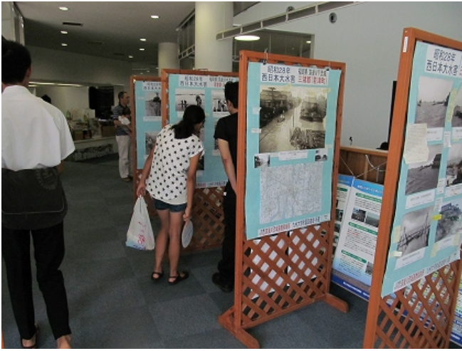
(8月 昭和28年大水害写真展)