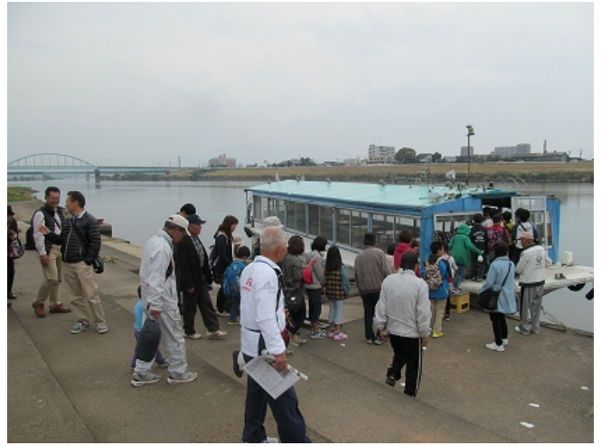
(11/8 久留米の歴史クルーズ・乗船)