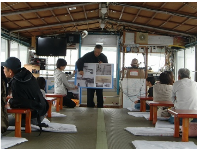
(11/8 久留米の歴史クルーズ・水害を語る)