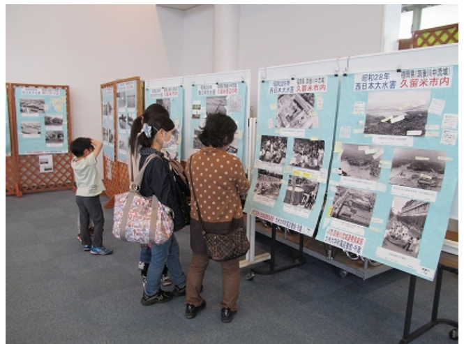
(11月 昭和28年大水害写真展)