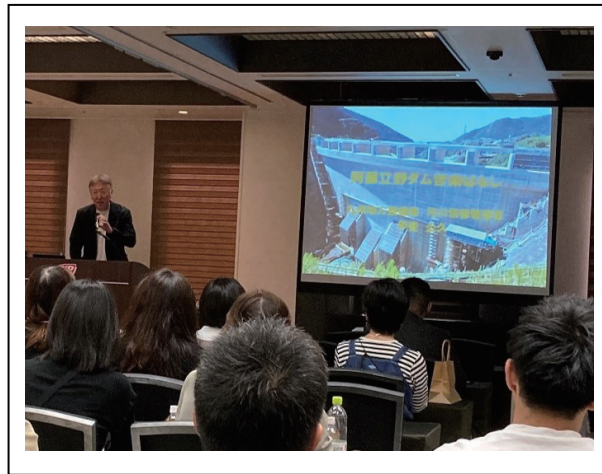
甲斐公久様による講演