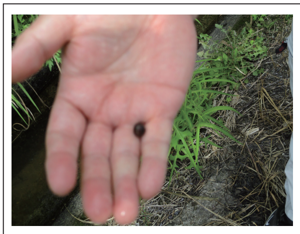
にいな の 補充