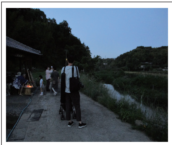
6月3日ホタル観賞会