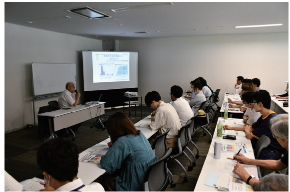
テーマ「長崎大水害に学ぶ」