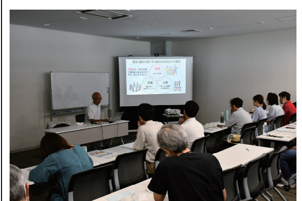
テーマ「自助・共助・公助について」