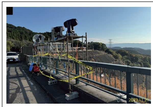
ムービングライト設置時(堤頂道路)