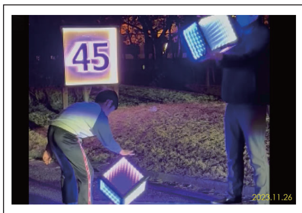
45周年記念看板・光のオブジェ