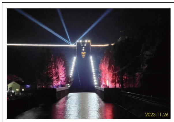
寺内ダム正面より(ムービングライト)