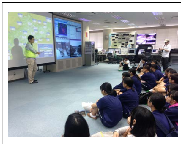
鶴田ダム研修：会議室にて再開発事業説明