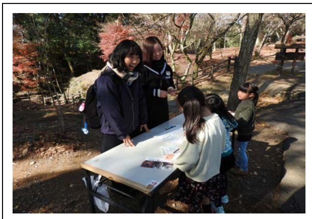
スタンプラリーポイント受付：曾木の滝