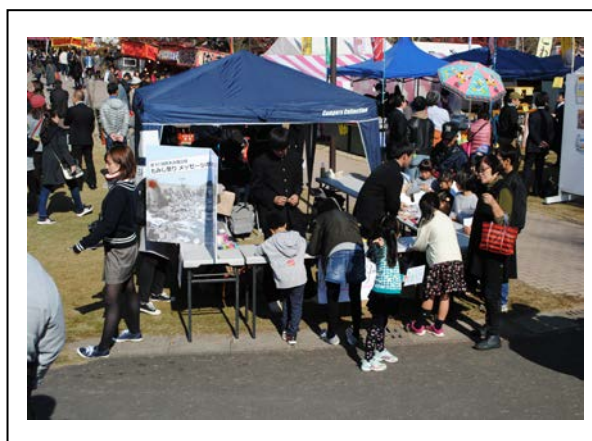
スタンプラリー受付外観：曾木の滝公園