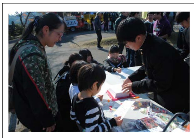
スタンプラリー受付：親子を高校生が対応