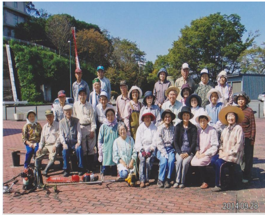
美化清掃活動参加者