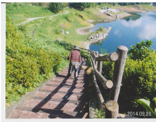
ダム湖周辺の清掃作業