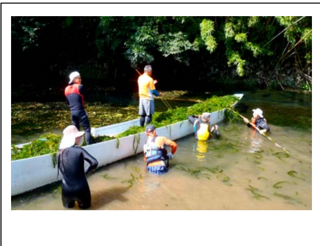
状況写真（藻取り船を使い駆除）