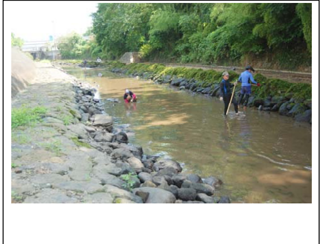
状況写真（藻とり後の川の状況）