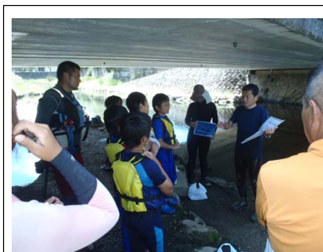
状況写真 (生物の生息状況や川の現状を知る)