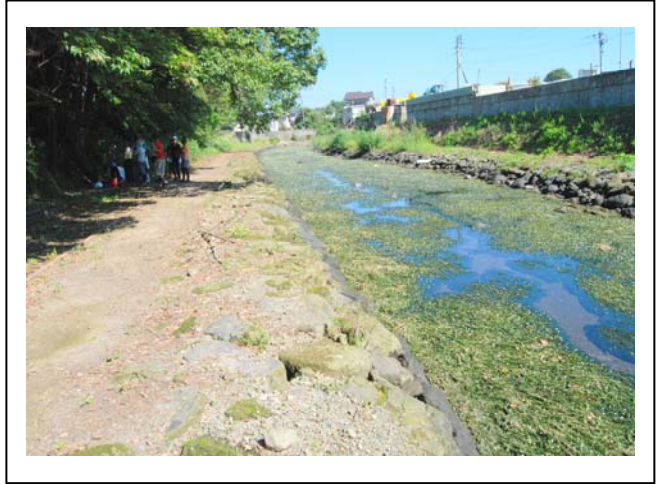
状況写真（川面に浮かぶ藻の状況・作業前）