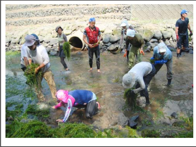
状況写真（根の部分から藻をとる作業）