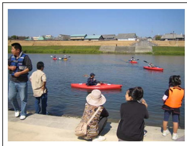
写真-4：子どもたちが順番待ちのカヌー教室