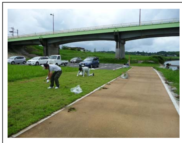
写真-2：根気良く伐根作業を実施