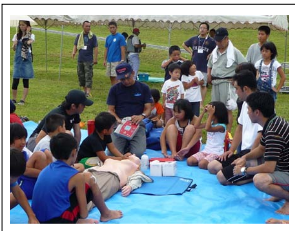
写真-3：心肺蘇生法の指導（消防署のご協力）