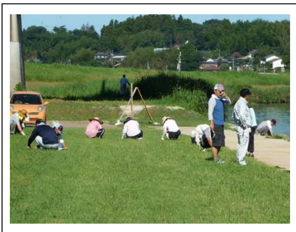
写真-5：伐根作業に多くの方が参加