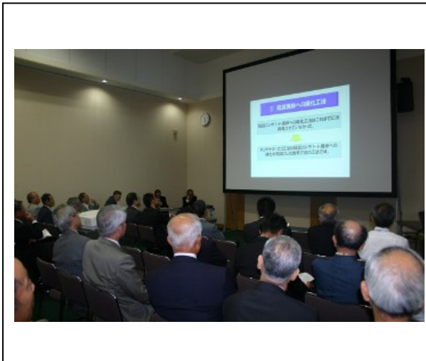
状況写真 プレゼンテーション会場